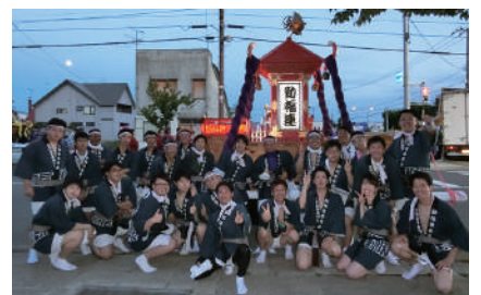
出航する前に全員で…いい写真だネ!!

今年も事業所の皆さま方のご協力を頂き、参加することができました。 次年度も各事業所のご協力をお願いいたします。 反省会の串とビール最高ですよ!!