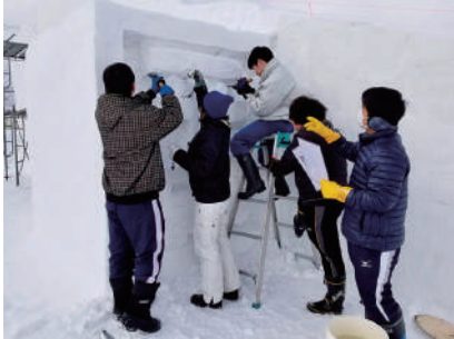
サマー 始めるヨー!

2. 26 ★第1回職業能力開発事業「在職従業員向け 接遇研修会」開催 参加者 6名