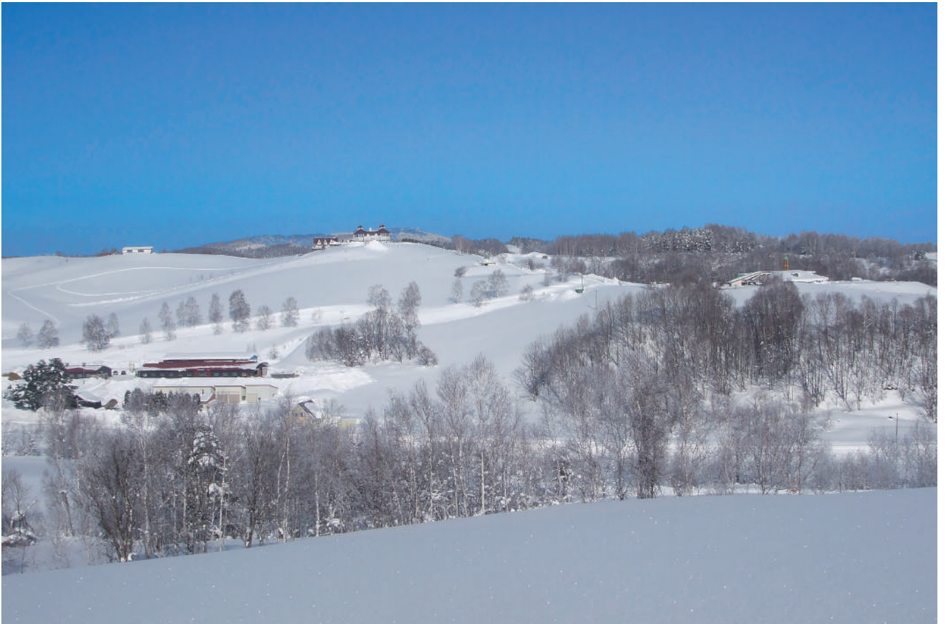
羊飼いの家(中央)と世界のめん羊館(右)