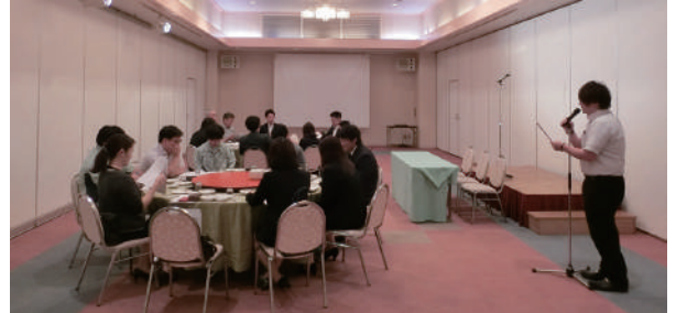
今年度の事業計画を立てています

6. 7 ★勤労者福祉連絡委員会推進員会議 議題～平成30年度事業報告、令和元年度 事業計画等について審議 参加者19名