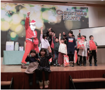
サンタさんプレゼントありがとう!!