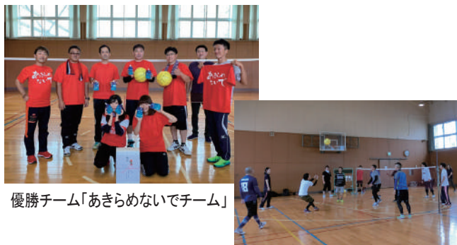
優勝チーム「あきらめないでチーム」