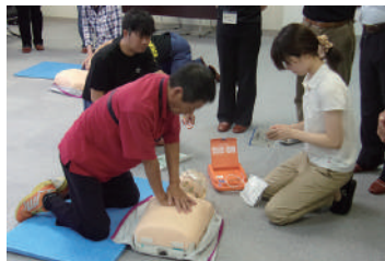
AEDのパットを付けます

救命隊が到着するまでの間、応急処置のAED使用及び心肺蘇生法等を学びました。 参加者 19名