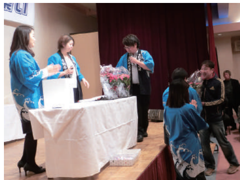
ポイントセア当たったヨ!

・恒例の立食パーティーで、364名の大勢の参加を頂き盛大に開催されました。抽選会には、19社69本の提供景品をいただき、合わせて173本、理事長賞(5万円相当の高周波治療器コリコラン、ヘッドスパ)委員長賞(3万円の灯油券)勤福連賞(土別市指定ごみ袋セット)抽選ごとに一喜一憂していました。 参加者は、ビールを飲み交わしながら、和気あいあいのなか会員同士の交流が深められました。