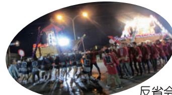
これから練り込が 始まるゾー

8. 13 ★地域活性化事業「天塩川まつり川舟みこし」 参加事業所 18事業 30名