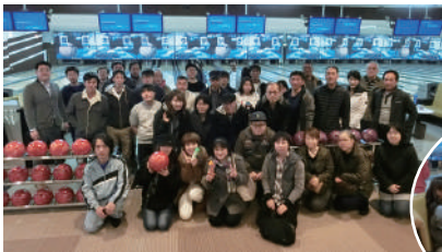
団体戦の集合写真

3. 4 ★親睦交流事業「ボウリング大会」開催 団体戦 10チーム 40名 個人戦 20名