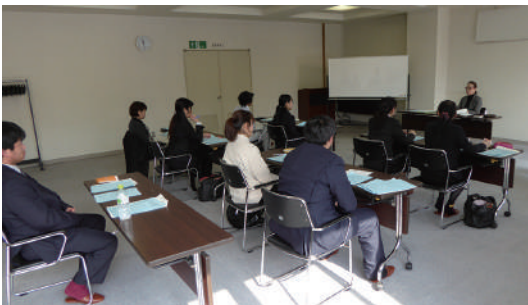
講師の話し真剣に聞いています

3. 5 ★第2回職業能力開発事業「在職従業員向け 接遇研修会」開催 参加者 9名