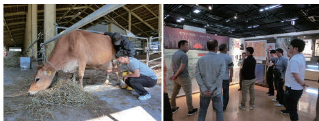
おっかなびっくり乳しぼり 北鎮記念館で真剣に説明を聞いています

ファームズ千代田では、みんなが初めての搾乳体験、トリックアートでは絵画の視覚的錯覚に驚き、男山では大雪山の万年雪から染み出る、伏流水で造られた日本酒を試飲した。うめえ～ 北鎮記念館では、屯田兵や旧陸軍第7師団などの歴史や、当時使われていた道具や武器、遺留品が多く展示されており、説明員の話聞き、北海道の歴史を学びながら、戦争と平和について考えさせられる研修であった。