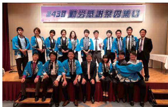
集いのスタッフ一同で!!お疲れさま