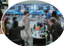
ナイス ストライク!!