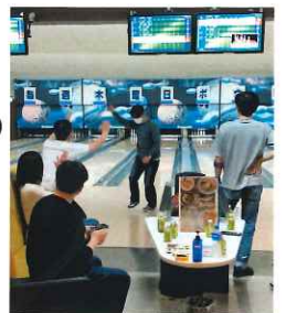
ナイス!! ストライク