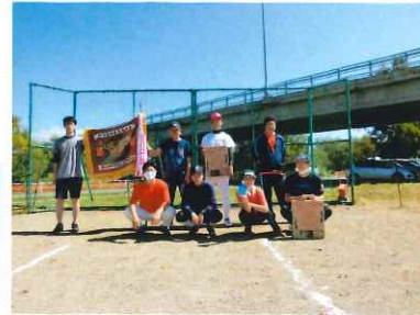
優勝の復活！オズチーム