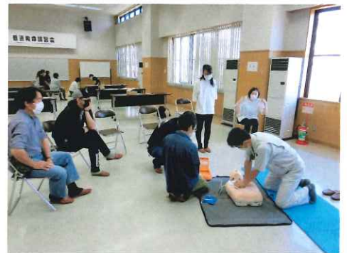
胸の真ん中を強く速く絶え間なく

3人1組になり、救急車を呼ぶ役や、AEDの操作をする役など交代しながら、救急隊が到着するまでの連携手順を確認しました。