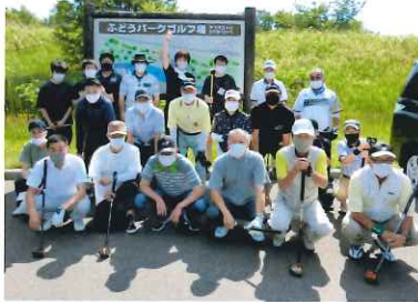
マスクで誰かわからない？