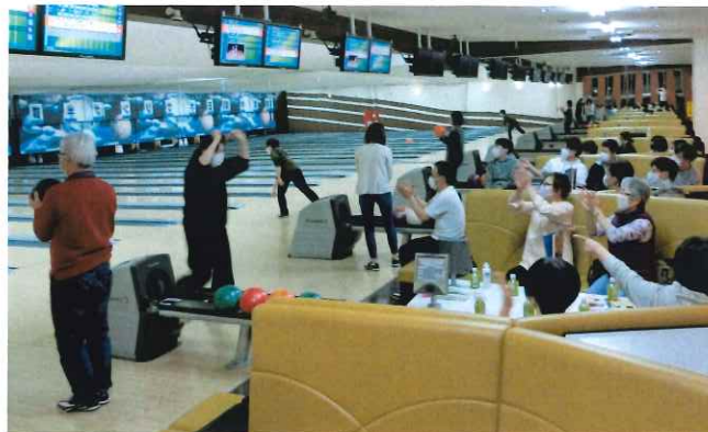
みなさん楽しそう