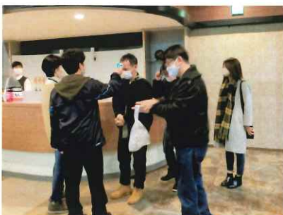
参加者の検温と消毒