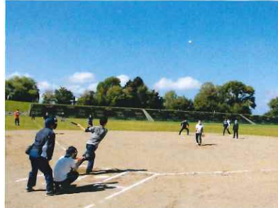
アア～ピッチャーフライ