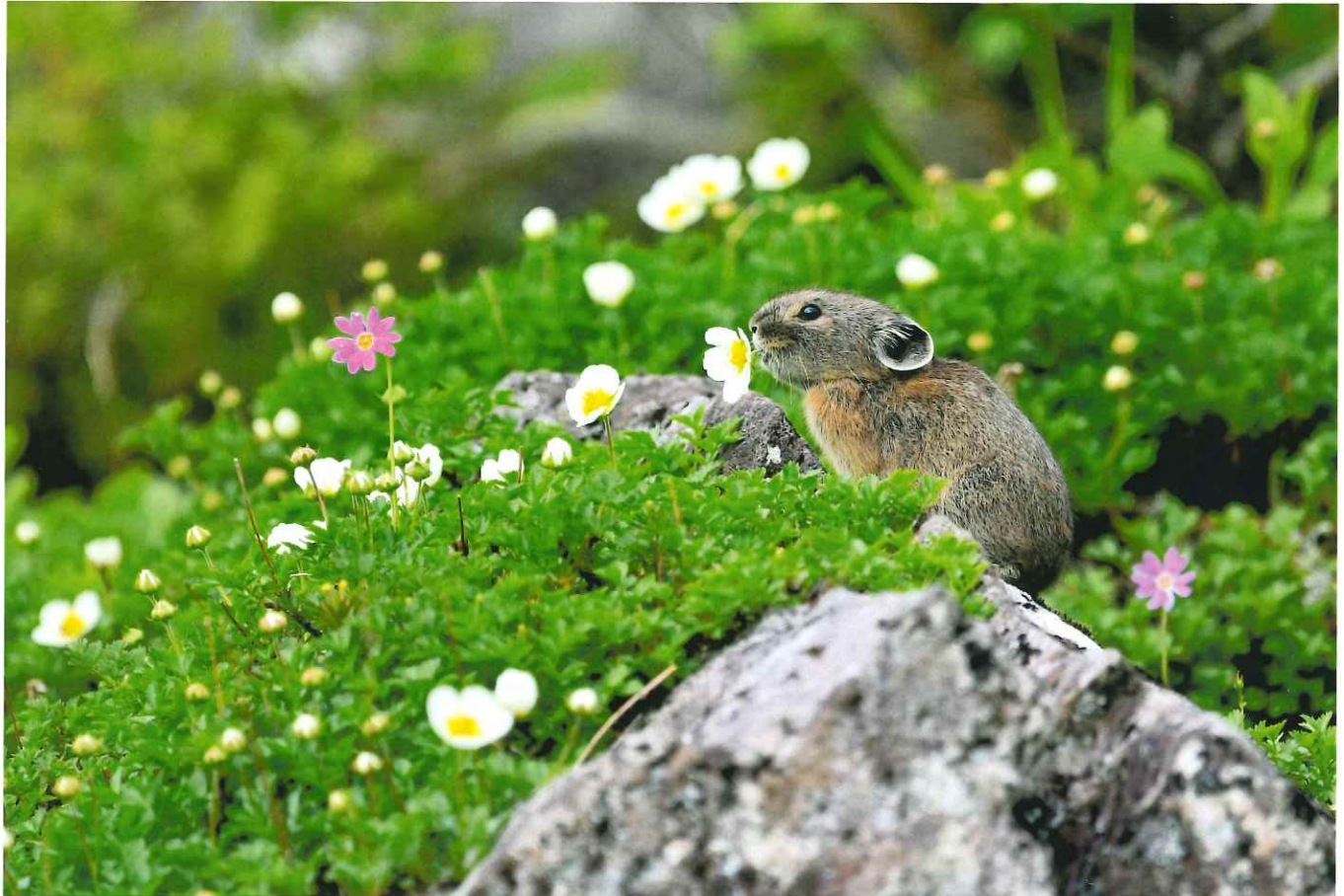
チングルマをくわえるナキウサギ 松実 務