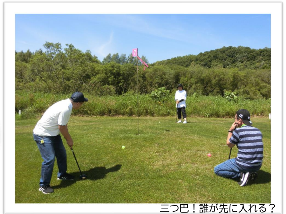
三つ巴！誰が先に入れる？

令和6年6月30日(日)ふどうパークゴルフ場で実施しました！ 参加者は15名で競い、晴天とほどよい風がそよぐなか参加者たちは気持ちを込めた一打一打を楽しんでいました。