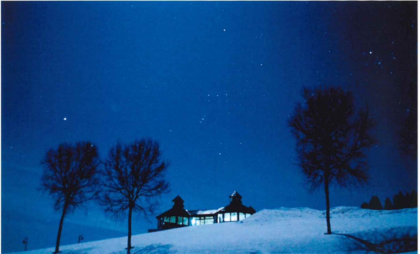
羊飼いの家(冬の夜)